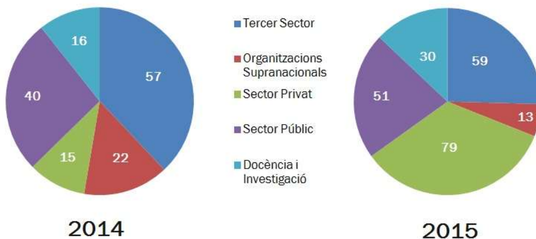
Fig 2. Sector al qual pertanyen les ofertes laborals publicades durant els primers sis mesos de l'any. Anys 2014 i 2015