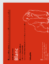
Blanc (2010) Autor: Jordi Solé i Comas Il·lustrador: Miguel Gallardo