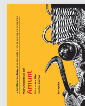
Amunt (2011) Autora: Marina Guardiola i Bufí Il·lustrador: Xevi Ribas

Pots fer-te membre de l'associació des del web http://helena.jubany.cat/associacio